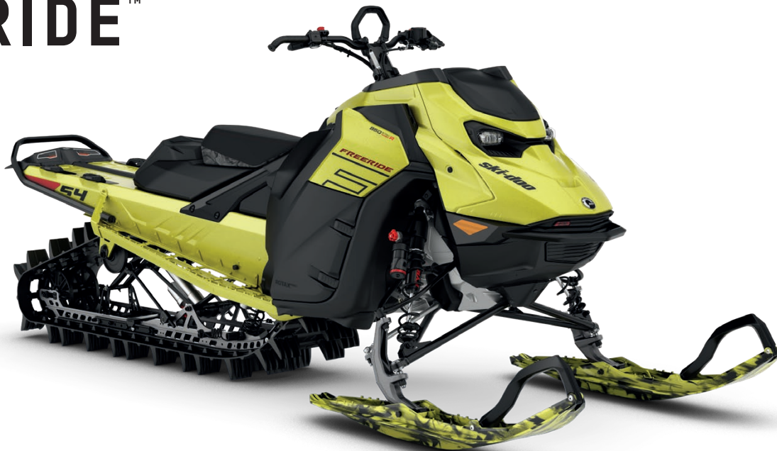
FREERIDE 154 850 E-TEC TURBO R VISAS